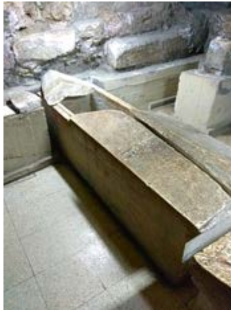
Гроб прав. Лазаря, Кипр.

ница с надписью «Лазарь Четверодневный, друг Христов». По указу императора Льва VI мощи Лазаря были перенесены в Константинополь в 898 году, где были положены в храме Праведного Лазаря.