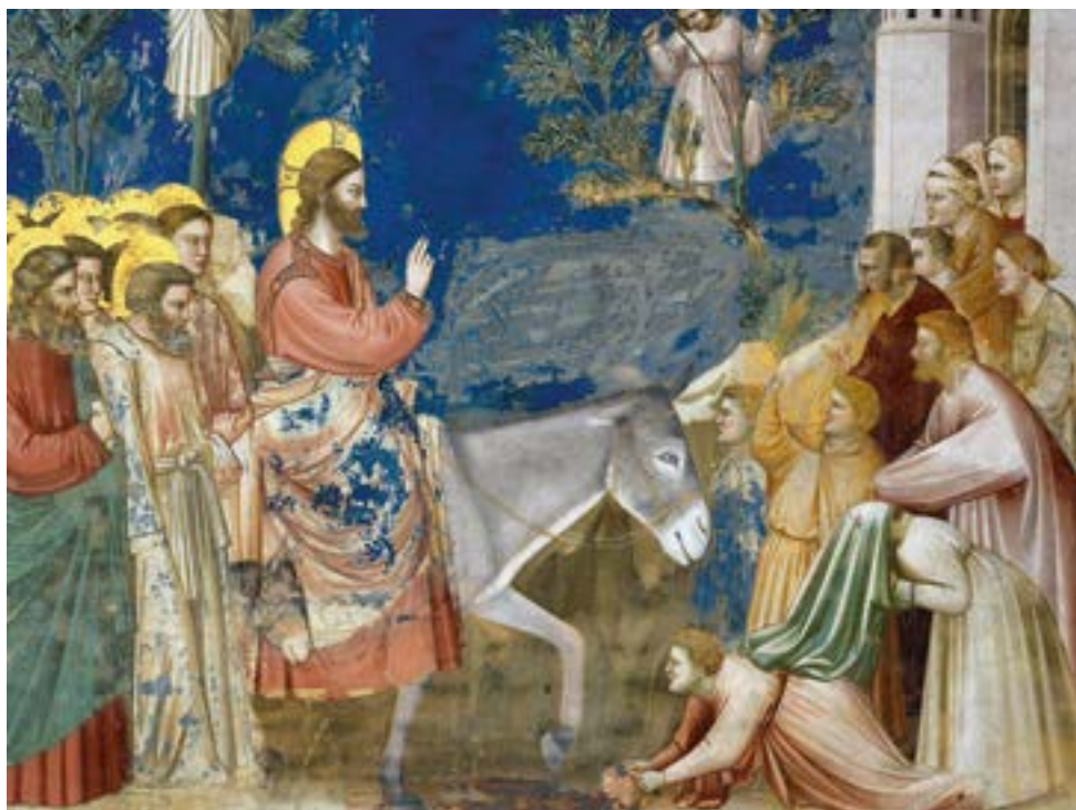
Вход Господень во Иерусалим. Капелла Скровеньи, Падуя. Джотто.

Когда подошли к пещере, в которой был погребён Лазарь, и отвалили от неё камень, Иисус стал молиться: «Отче! благодарю Тебя, что Ты услышал Меня. Я и знал, что Ты всегда услышишь Меня; но сказал [сие] для народа, здесь стоящего, чтобы поверили, что Ты послал Меня». Сказав это, Он воззвал громким голосом: «Лазарь! иди вон» (Ин. 11:41–43). После этих слов из пещеры вышел воскресший Лазарь, «обвитый по рукам и ногам погребальными пеленами». Иисус повелел развязать его. Многие видевшие это чудо уверовали в Иисуса как в Мессию, но фарисеи