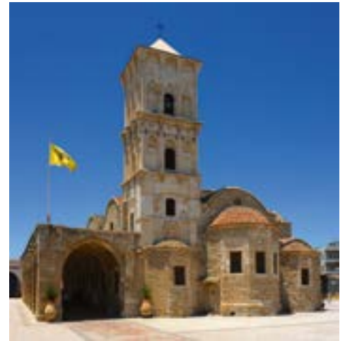
Церковь прав. Лазаря, Кипр.

Уникальный барочный иконостас церкви был сделан между 1773 и 1782 годом. Вскоре он был позолочен и расписан. Внутреннее убранство храма сильно пострадало во время пожара в 1970 году. Во время ремонта церкви в ноябре 1972 года под алтарём был обнаружен мраморный саркофаг с человеческими останками, которые идентифицировали как мощи святого Лазаря, которые, по-види-