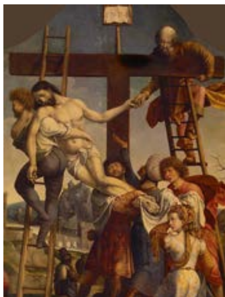
Ян Госсарт "Снятие с креста"

Сегодня трудно представить, что в течение многих десятилетий после смерти Бах оставался практически неизвестен широкому слушателю. Из небытия «Страсти по Матфею» вывел начинающий композитор Феликс Мендельсон, известный многим благодаря своему свадебному маршу. Ему было всего 14 лет, когда он получил от бабушки в подарок партитуру «Страстей по Матфею». Познакомившись с самым грандиозным произведением Баха, Мендельсон несколько лет вынашивал планы по его исполнению и воплотил их в жизнь