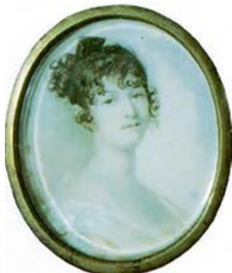
Надежда Осиповна Пушкина

Стихотворение «Отцы пустынноики и жены непорочны...» имеет точную дату: 22 июля 1836 года. Оно переложение известной православной молитвы Ефрема Сирина, читаемой в дни Великого поста. Что же заставило Пушкина в июле 1836 года обратиться к великопостной молитве? Главной причиной биографы и литературоведы считают воспоминание поэта о смерти матери в Пасхальное воскресенье 29 марта 1836 года. В тот год 21 июня, день рождения Надежды Осиповны Пушкиной, впервые отмечался как день