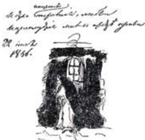
Черновик стихотворения и рисунок Пушкина

была там факсимилирована как есть и с рисунком. Это хорошо будет в 1-й книге «Современника».